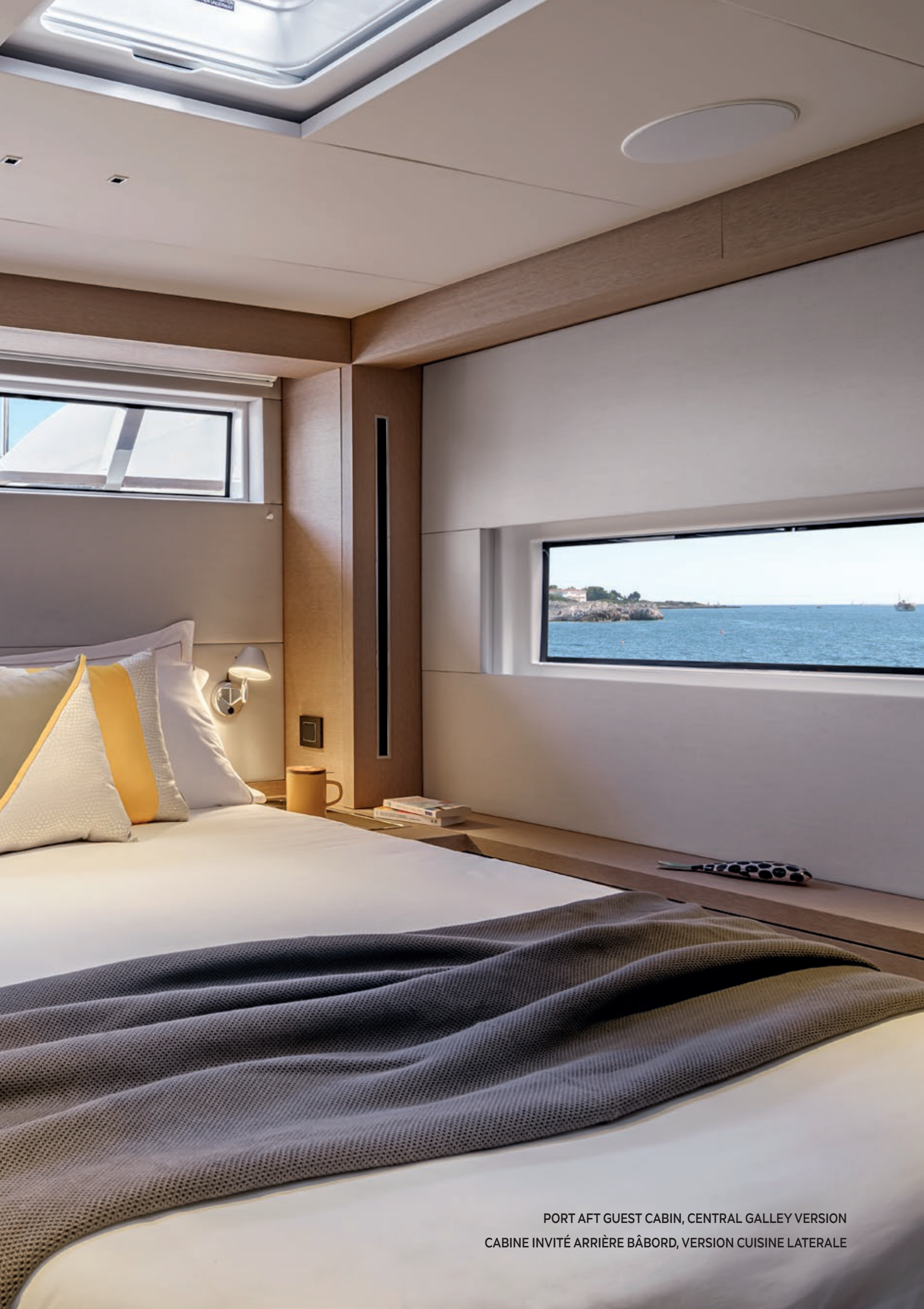
PORT AFT GUEST CABIN, CENTRAL GALLEY VERSION CABINE INVITÉ ARRIÈRE BÂBORD, VERSION CUISINE LATÉRALE