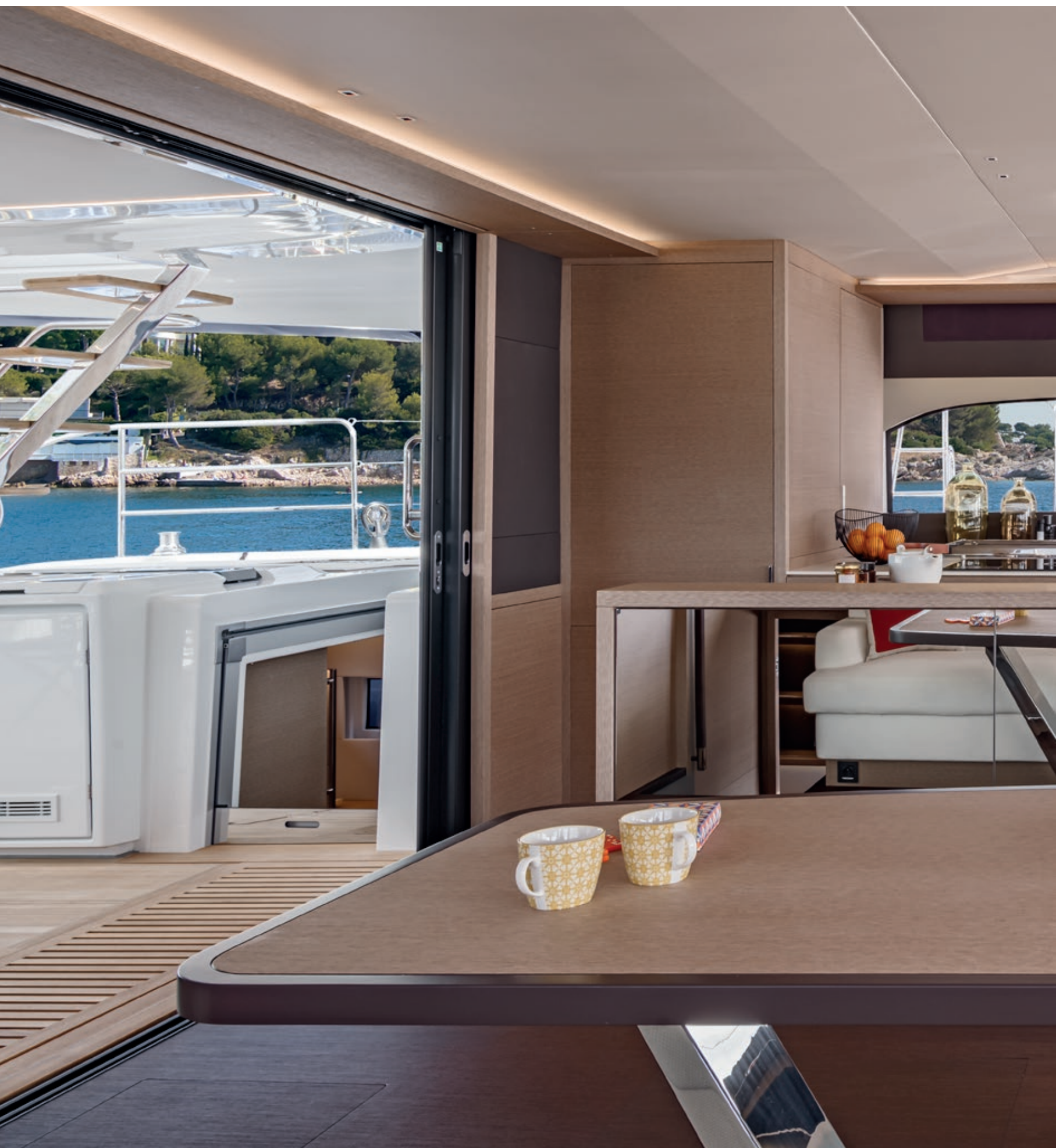
THE SALOON, CENTRAL GALLEY VERSION