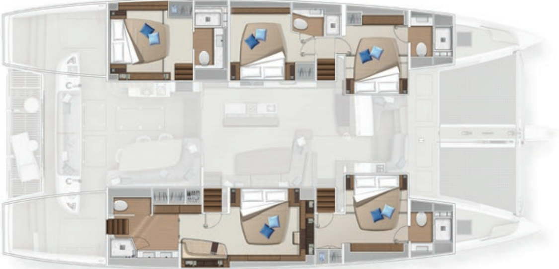
5 cabins - 5 cabines