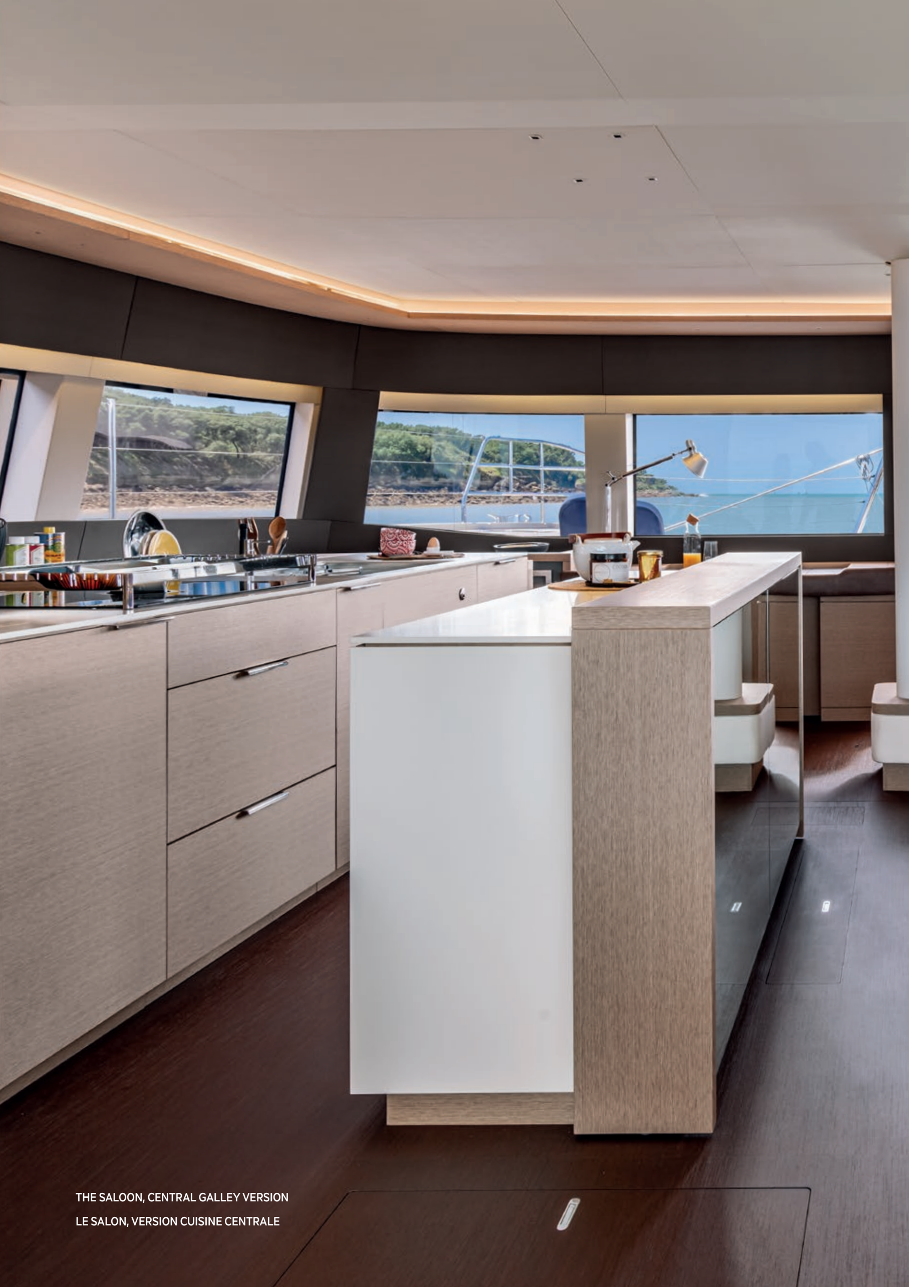
THE SALOON, CENTRAL GALLEY VERSION LE SALON, VERSION CUISINE CENTRALE