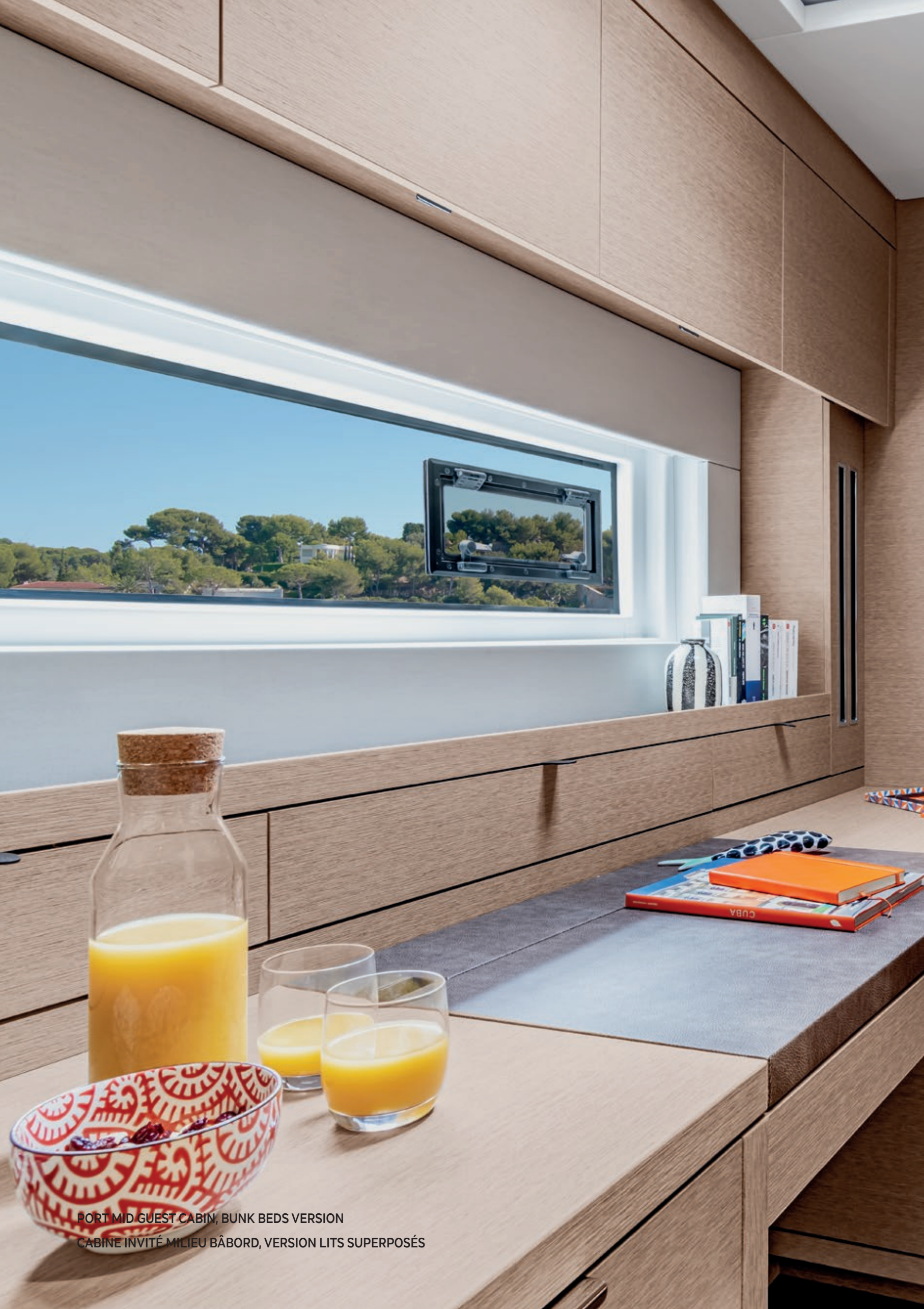
PORT MID GUEST CABIN, BUNK BEDS VERSION CABINE INVITÉ MILIEU BÂBORD, VERSION LITS SUPERPOSÉS