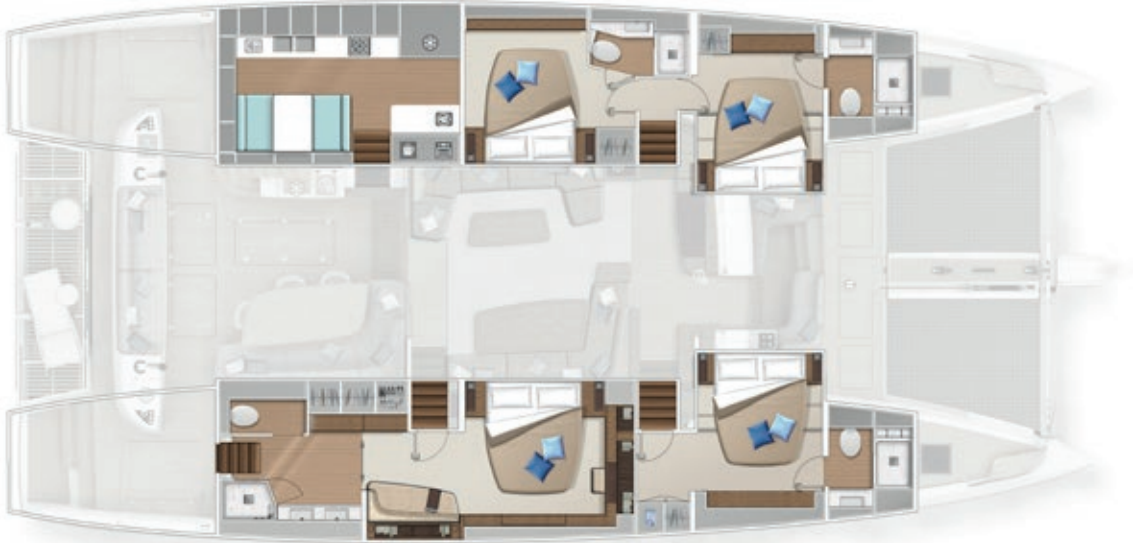
4 cabins - 4 cabines