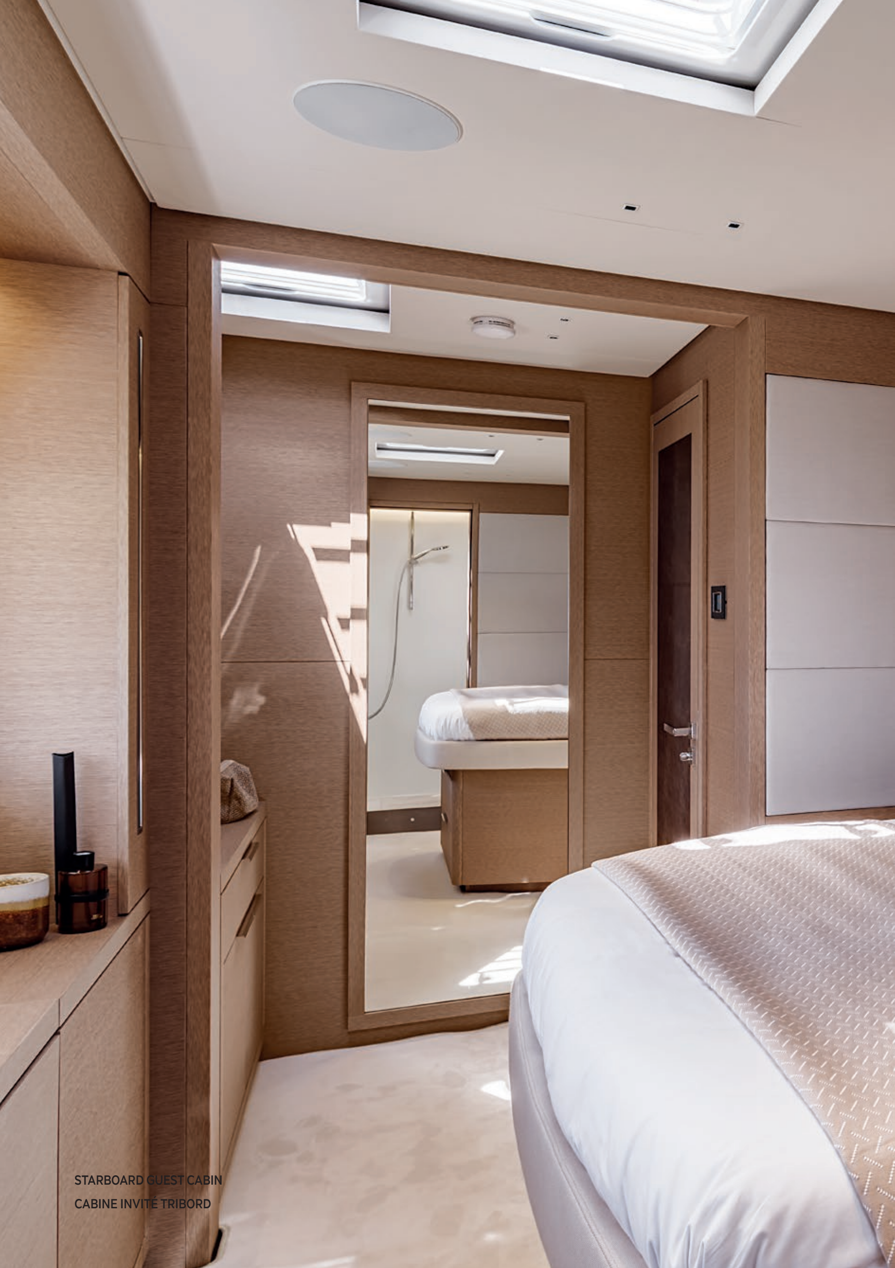
STARBOARD GUEST CABIN CABINE INVITÉ TRIBORD