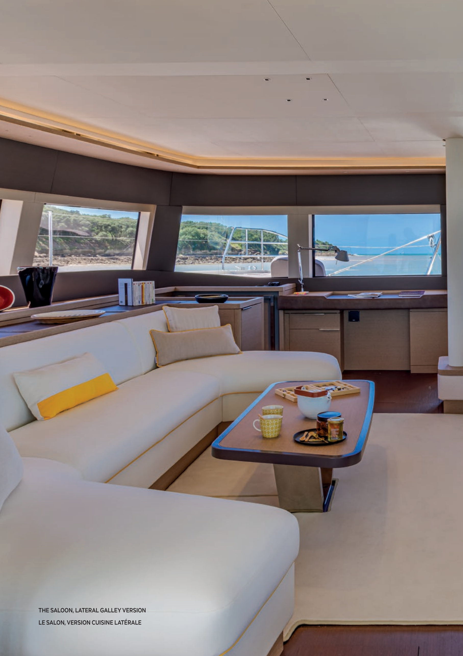
THE SALOON, LATERAL GALLEY VERSION LE SALON, VERSION CUISINE LATÉRALE