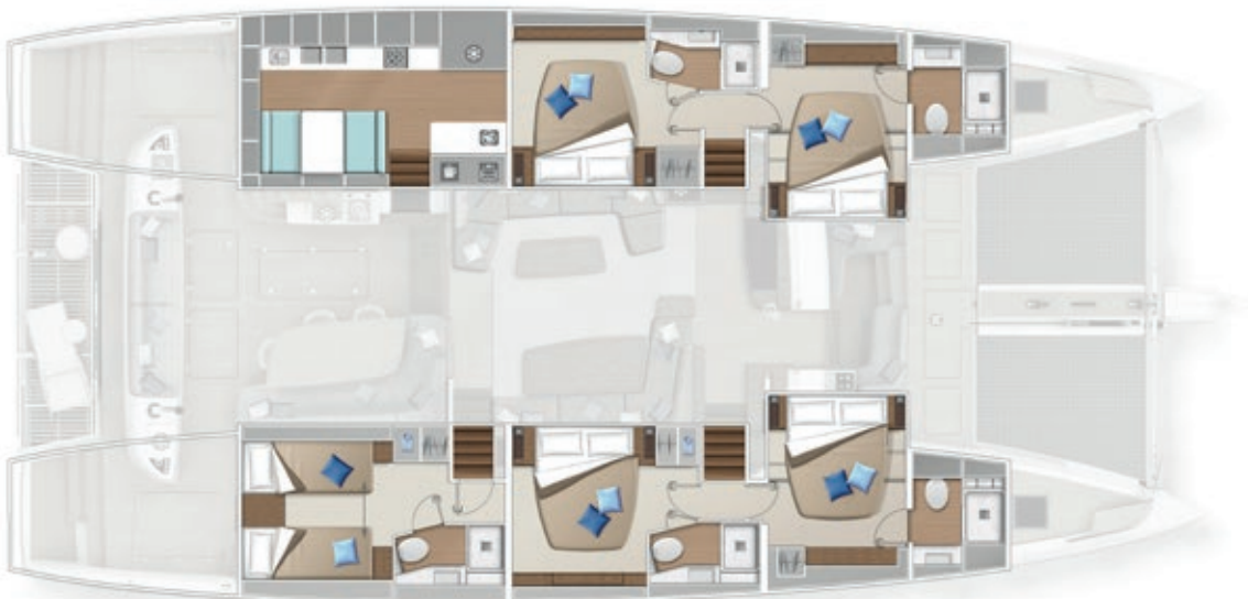
5 cabins - 5 cabines